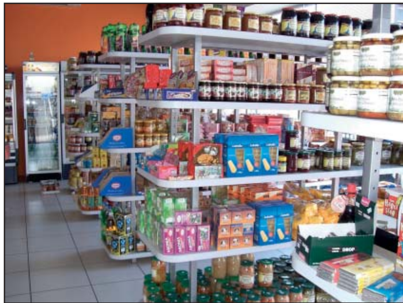
Sklep Skazka, gdzie Polacy zaopatrują się w rodzimą żywność