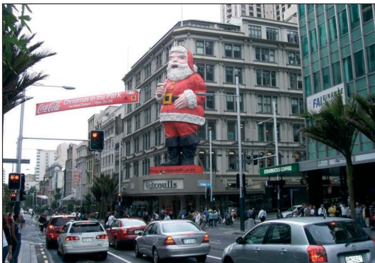
Święty Mikołaj na skrzyżowaniu Queen Street i Victoria Street w Auckland

– Dobrze mówię po angielsku, ale nigdy nie wpadłabym na to, że na antypodach produkt, który najbardziej przypomina twaróg, może nazywać się Quark. Nikt z Polonii, nawet ci, co mieszkają tu od dziesiątków lat, nie rozszyfrował tej nazwy, dlatego nie podzieliliśmy o jego istnieniu. Ciekawość mnie podkusiła, żeby sprawdzić, co to jest ten Quark, bo pewnie do tej pory starałabym się robić sernik ze słonego